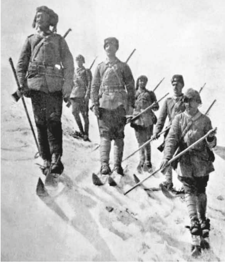
Sarikamiş'ta Türk askerleri.

Erzak ve cephane kolları dışında asıl gücü 28 bin er olan 9. Kolordu'dan ocak ayı başında 1000 er kalmıştı. Harekâtın başında mevcudu 40 bin er olan 10. Kolordu'dan şimdi ayakta ve bir arada kalan er sayısı 1800'dü. 4