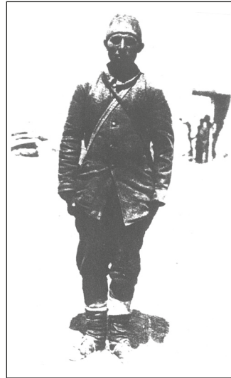
Ayağında çarıklarıyla Mehmetçik. Harbe gönüllü katılmış.