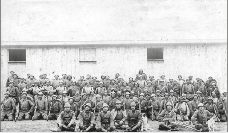
Padişah tarafından 57. Alaya verilen madalyanın takılma töreni.