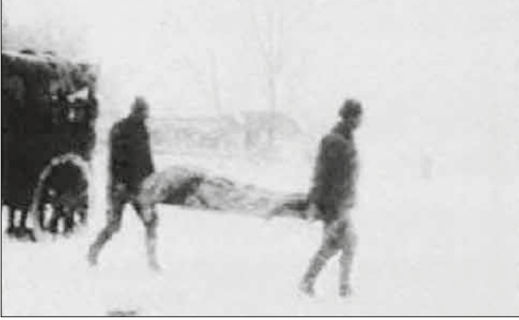
Zorluklarla cepheye ilerleyer askerler...

9. Kolordu'nun 87. Alayı Çerkez köyü denilen Eski Sarıkamış'ı almış ama orada mahsur kalmıştır. Rus kuşatması Alay'ın ileri ya da geri gitmesine engel olmaktadır.