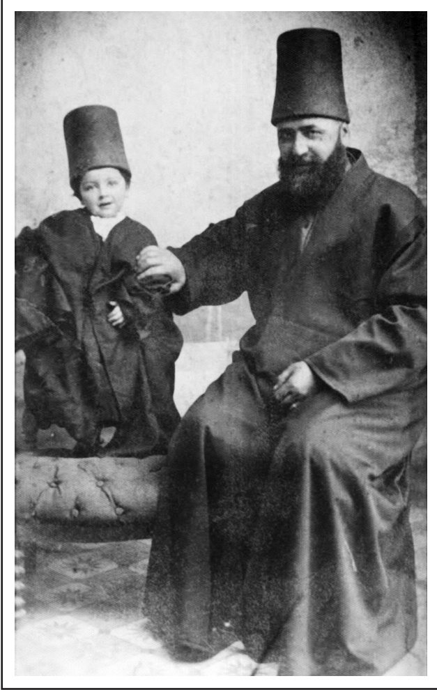
Veled Çelebi'nin çocukluğu (muhtemelen)