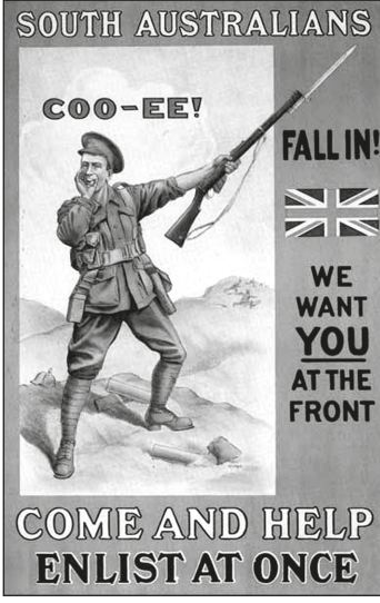
Anzakları savaşa çağırın bir afiş.

Olay Avustralya'da geçer. Debbie Reys adındaki kişi, bir gün dedesinin yıllar önce yaşadığı evi ziyaret eder. Dedesi Elio Cambell ise eski bir Çanakkale gazisidir. Dedesinin evini ziyareti sırasında bazı hatıra eşyaları dikkatini çeker. Bunların içinde, dedesinin hatıralarını kaydettiği yazıları dikkatle okumaya başlar. Dedesi bu çarpışma hatıralarının bir yerinde aralarındaki ateşkeslerden şöyle bahsetmektedir: