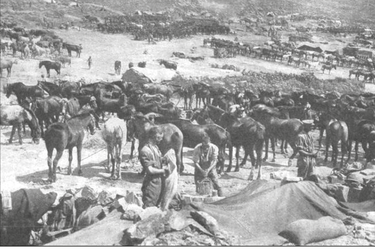
Suvla'da düşman askerleri.

Avustralyalı bir subay bakın neler anlatıyor: