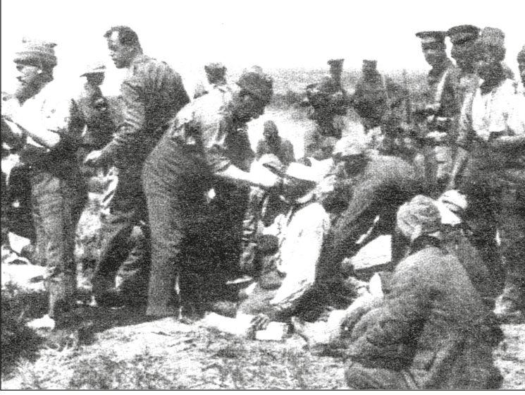
Üçüncü Kirte Muharebesi sonrasında yaralılar.