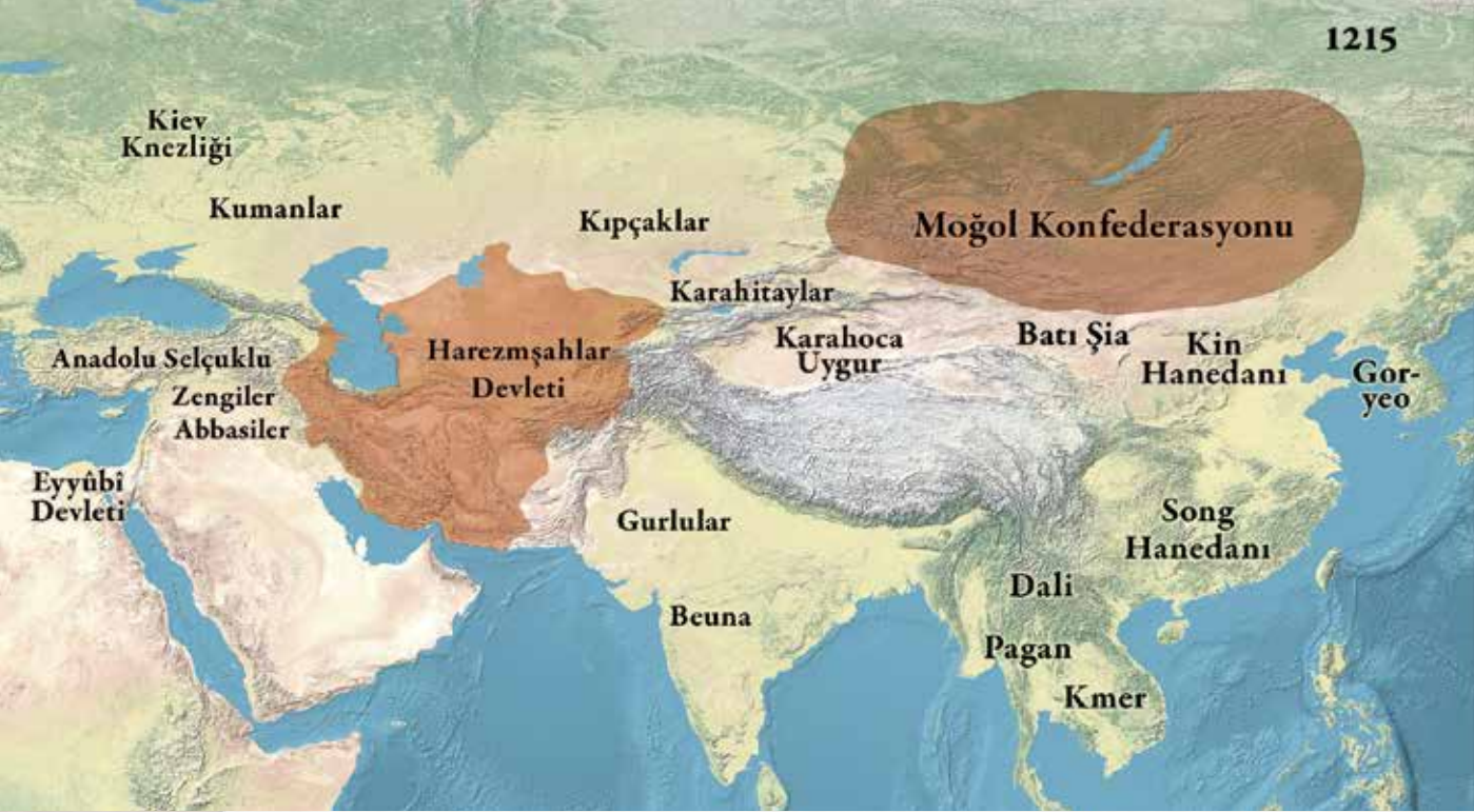
Harezmsahlr ve Moğollar, 1210'lar