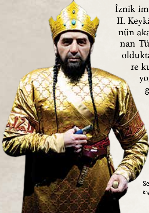
Selçuklu Sultanı IV. Kılıçaslan, ö. 1266, (DNA ve anatomi analizine dayalı rekonstrüksiyon)

Keykâvus kardeşiyle anlaşmazlığa düşünce mücadele yeniden başladı. Ona tâbi Sivrihisar yöresindeki Türkmenlerden asker toplayan Ali Bahadır, Konya üzerine yürüdü, fakat yenildi ve uç Türkmenlerine sığındı. Keykâvus ise kaçarak İstanbul'a geldi, oradan da 1278'de Kırım'a yollandı. Keykâvus İstanbul'da iken Ali Bahadır da onun yanına