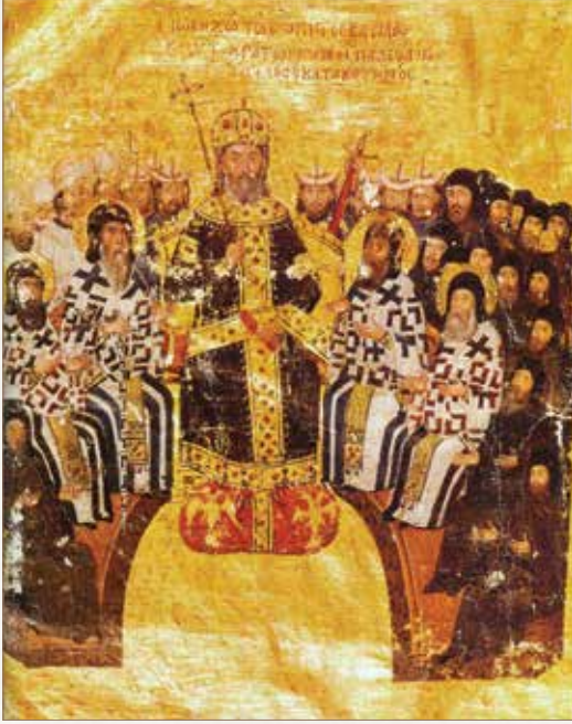
VI. İoannis Kantakouzenos: 1347-1354 İoannis kilise meclisini idare ederken, 1351. (Ms. grec 1242, vr. 5v, [1370-75 arası] Bibliothèque nationale de France, Paris)

Kaynak: https://commons.wikimedia.org/wiki/File:John_VI_Kantakouzenos.jpg