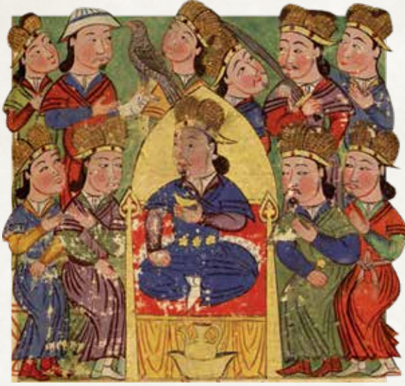
İlhanlı Hükümdarı Geyhatu (1291-95) tahta çıkıyor