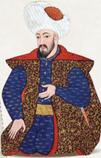
Osman Bey Nakkaş Osman'a ait Osman Bey minyatürü: Seyyid Lokman Çelebi, Kıyafetü'l- İnsaniyye fi Şema'ili'l-Osmaniyye (1579)