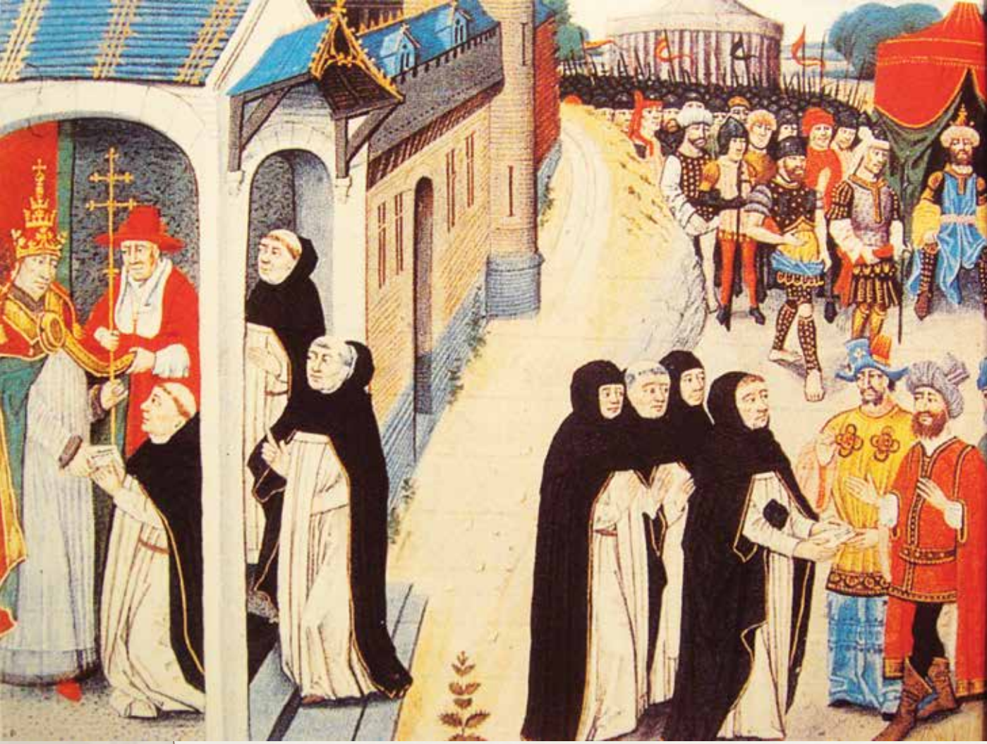
Moğolların İran Valisi Baycu Noyan (sarı kaftanlı), Papa IV. Innocentius'un (solda) mektubunu kabul ediyor. Kaynak: David Aubert, Chronique des Empereurs, 1462.

İznik imparatoruna sığınması yeni gelişmelerin habercisi olmuştu. II. Keykâvus mücadeleyi sürdürme azmi içinde Baycu'nun dönüşünün akabinde Denizli yöresinde yoğun bir şekilde yerleşmiş bulunan Türkmenlerle beraber Konya'ya geldi (1257). Duruma hâkim olduktan sonra ülkeyi kardeşi Kılıçaslan ile ikiye bölüp ortak idare kurmayı tercih etti. Bu durum batıdaki Türkmen kitlelerinin yoğun biçimde yerleşmiş oldukları uç bölgesi açısından yeni gelişmelerin zeminini hazırladı.