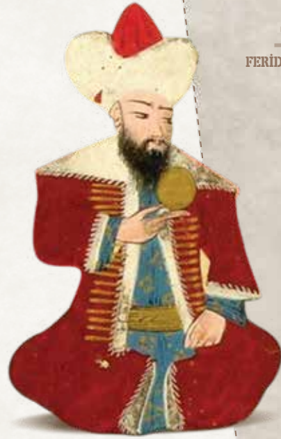
Orhan Bey Nakkaş Osman'a ait Osman Bey minyatürü: Seyyid Lokman Çelebi, Kıyafetü'l-İnsaniyye fi Şema'ilil- Osmaniyye (1579)

Ol evân-ı sa'âdet-iktirânda sinn-i şerîfleri kırk altı yaşından ziyâde olmagın mehâsin-i latîfnde ak eseri belürüp lâkin kuvvet u kudreti temâm kemâlinde idi ve çehre-i nurânileri beyâza mâ'il olup kırmızı öztirak gird ü mehîb ve benâgûşunda bir dâne hâl-i dil-firîb olup 'âlem ol cevher-i ferdün kemînebendesî ve şâhmen-dî gulâm-ı efkendesî sayılırdı ve kaşları hilâl gibi çatma olup kassâm bahr-ı hüd keffe keffi ve mübârek kulakları dürr-i nasîhat sadefi olmagla koyun elâ gözlü ve koç burunlu ve tatlu sözlü sînesi yassı ve alni açuk gerdân ü kâmet-i latîfleri bülend ve cism-i cesîmi kuvvetlü vü ercümend ve üzengiligi uzun gürbüz ve pençesi aslana benzer yaraşuk sakallu ve keşîde bahâdırâne bıyıklu gayûr u kakhâr sabûr u kîne-güzâr hüdâvendigâr-ı kâm-kâr ve şehriyâr-ı nâmdâr idi ki misli 'ahdinde bulunmayup hulkî hilkî vü latîf tabî'î olmagla cânını hadden efzûn ve bi'l-cümle matbû' mevzûn idi ki şekilleri tasvîr olunur (23b-24a)