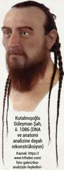
Kutalmışoğlu Süleyman Şah, ö. 1086 (DNA ve anatomi analizine dayalı rekonstrüksiyon)

Kaynak: https://www.trthaber.com/foto-galeri/dna-analiziyile-heykelleri-yapilan-selcuklu-sultanlari/63835/sayfa-7.html