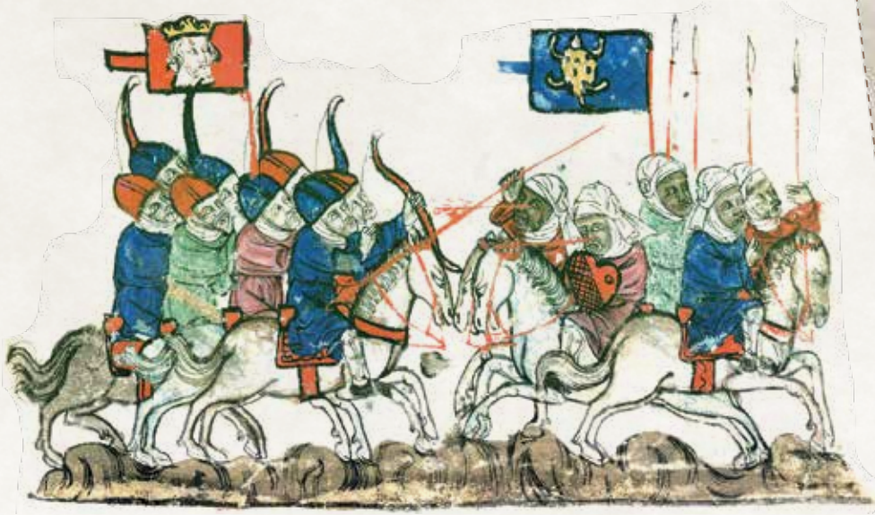
Kösedâğ Muharebesi, 1243