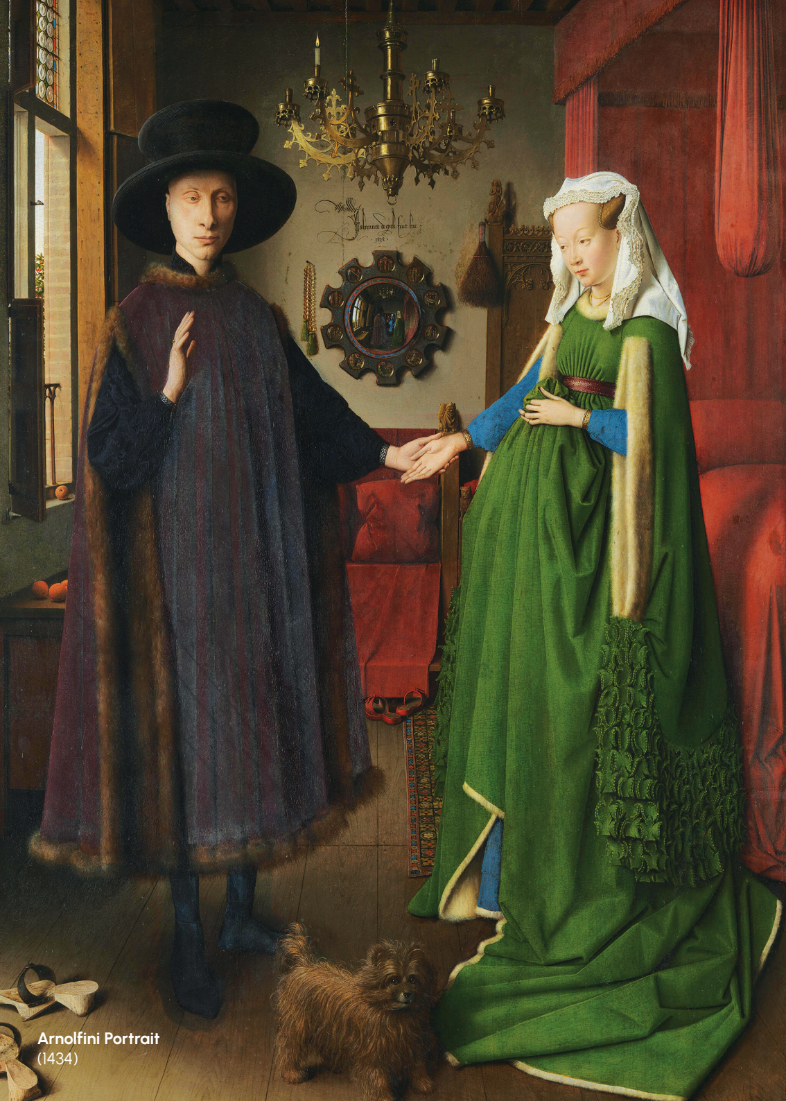
Arnolfini Portrait (1434)