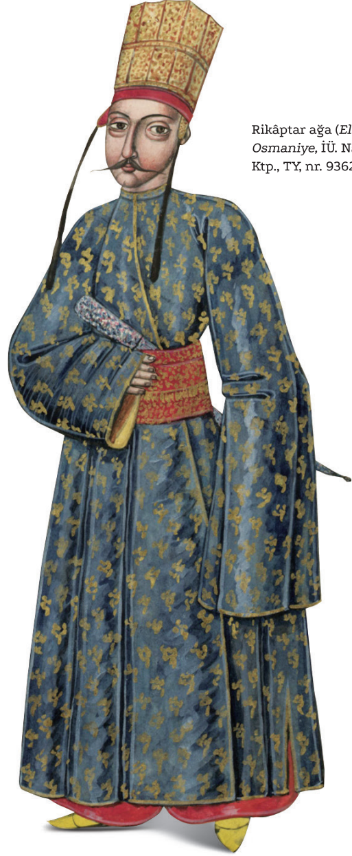
Rikâptar ağa ( Elbise-i Atika-i Osmaniye , İÜ. Nadir Eserler Ktp., TY, nr. 9362, s. 7).