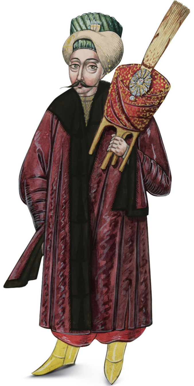
Cuma selamlığında padişahın kavuk ve sarığını taşıyan sarıkçıbaşı ( Elbise-i Atika-i Osmaniye , İÜ. Nadir Eserler Ktp., T.Y, nr. 9362, s. 10).

18 kişilik diğer mabeyn görevlileri ise padişahın birinci ve ikinci imamı, başmuship, hademe-i hassa ve musika-i hümayun feriki, hazine-i hümayun kethüdası, istabl-ı âmire müdürü, mabeyn birinci müdürü, teşrif-i hümayun memuru, mabeyn ikinci müdürü, ceyb-i hümayun kâtibi, hazine-i hümayun başkâtibi, babüssaade ağası, has oda kethüdası, padişahın baştabibi, birinci ve ikinci kapıçuhadarı ve telhisî-i evvel ve