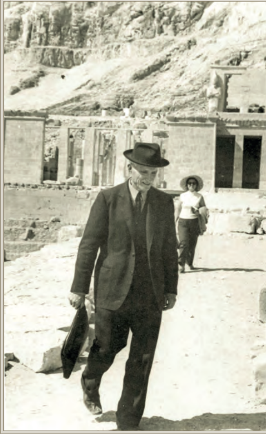
Kâzım Baykal Mısır seyahatinde

Bursamız'ın önde gelen şahsiyetleriyle Eski Eserleri Sevenler Kurumu'nu tesis etmişler, pek çok eserin ihyasına muvaffak olup, Bursa abidâtının ban-i sanisi olarak anılmaya hak kazanmışlardır. 1946 ve sonrasının henüz تنها ve Bursalılardan ibaret olan şehrimizin sükûnetli ikliminde, şahsiyetlerine ve mesai arkadaşlarına olan itimadın, o günkü resmî daireler ve idarecilerinden gördükleri alâka, teşvik ve kolaylıkların, hatta çalışmalarına ciddiyetle katılmalarının müspet neticeler alınmasında büyük bir tesiri olmuştur.