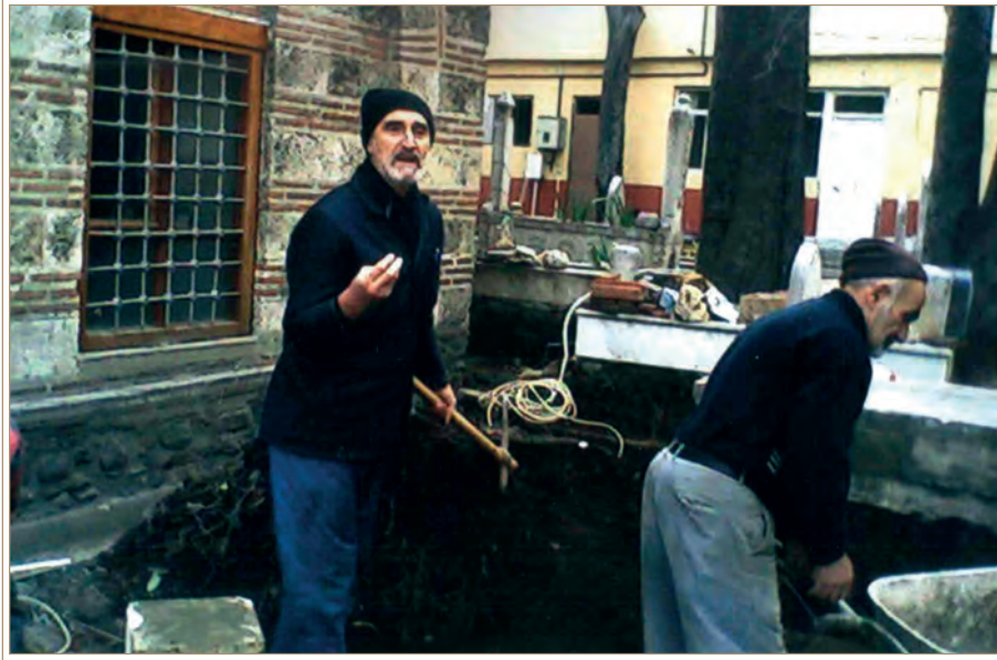
Timurtaş Paşa ve ahfadının haziresinde ihya faaliyeti esnasında

Bursa'da Yıldırım Bâyezîd Han'ın devri Osmanlı Devleti'nin ikinci Rumeli Beylerbeyi olan Timurtaş Paşa ve ahfadına ait lahitlerden müteşekkil hazire, en önemli çalışmalarımızdandır. Yine Bursa civarı köylerinden Abolyont'da balık ağlarına kurşun tedariki için sökülen çengeller ve diğer sebeplerle yıkılıp kırılarak yere geçen, nefye (sürgün) uğramış büyük bir yeniçeri ailesine ait hazireyi, tekrar ihya edip ayağa kaldırdığımızda, taş malzeme kullanılarak vücûda getirilip ölümü bile bize özendirebilecek kültürümüzün saltanatını gelip temaşa eden küçük bir köylü çocuğunun heyecanla "ölesim geldi" nidası boşa çalışmadığımız hususunda bizleri ümitvar etmiştir.