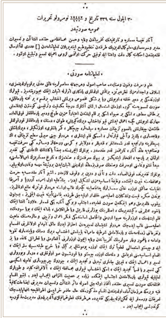
Kemaleddin Bey'in 1923'te tarihî eserlerin nasıl korunması gerektiğine dair dikkat çektiği hususları havi talimatnamenin eski metni

İşbu aksam-ı muhtelifenin suret-i tamiri hakkında ittihaz olunacak usûle dair İnşaat ve Tamirat Müdüriyeti izahat-ı kâfiye-i fenniye vermeğe her zaman amâde olduğundan aksam-ı mezkûrenin hal-i hazır harabiyetini etraflıca ifham edecek ta'rifat ve resimler ile mümkün olabildiği takdirde her tarafının fotoğrafları aldırılarak müdüriyet-i mezkûreye gönderilmesi icap eder.