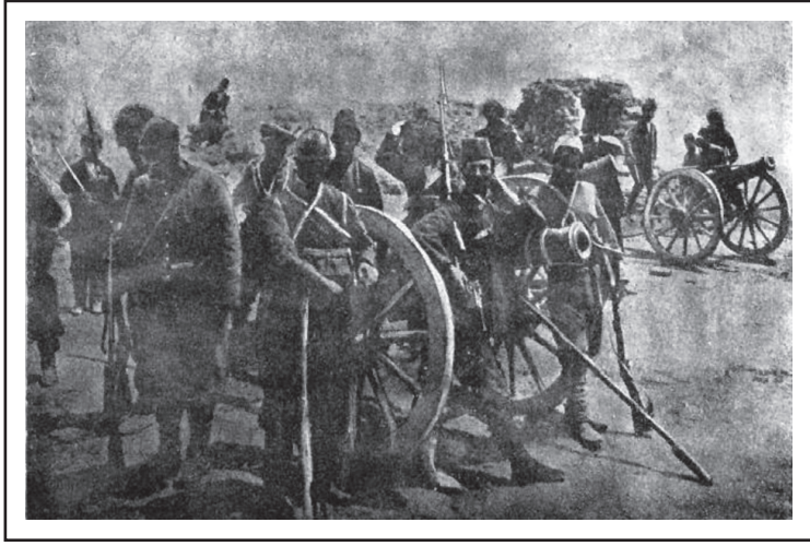
Van'ın Rus ordusu tarafından işgalini kolaylaştırmak için isyan eden Ermenilerin Osmanlı askerlerine karşı siperlerde çarpışmaları.

kendi kendilerini yönetme hakkı elde etmekte. Yöntem olarak, Ermenileri örgütlemek, onlardan para yardımı almak, ihtilalci fikirlerin yayılmasını sağlamak, meşru müdafaa ruhunu onlara aşlamak, askeri disiplin içerisinde silah kullanmasını öğretmek, silah ve para desteğinde bulunmak ve gerilla kuvvetleri oluşturmaktı. Yöntemler kısmında dikkati çeken maddelerden biri ise genel bir ihtilal için dış dünyadaki şartların uygunluğuna yani büyük devletlerin ve komşu ırkların desteğini kazanmaya dikkat edilmesiydi. 4