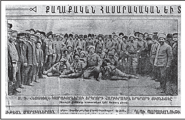
Ermeni Hınçak Gönüllü Alayının İkinci Bölüğü, Yeridassart Hayastan (Genc Ermenistan) gazetesinden, 20 Temmuz 1915.

güvencesini sağlayabilmek ve özgür bir gelecek kurma mücadelesi için devrimci isyan hareketlerine destek olmalıyız. Bunlar olmaksızın günümüz dünyasında herhangi bir balkın hak elde etmesi sadece bir rüyadır. Savaşla özgürlüğünü elde edemeyen, ona layık değildir.” 6