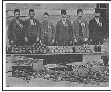
Adapazarı'nda ele geçirilen çeşitli bombalar ve silahlarla bunların yapımı için gerekli aletler, komitanın önemli üyeleri, bomba yapımcıları ve dağıtımçıları gösterir fotoğraflar.

neden olmuştur. Bu hareketlerden etkilenen son grup, Ermeni cemaatidir. Yunan ve Sırp bağımsızlık hareketlerinde, daha sonra Bulgaristan'daki olaylarda görülen yöntem, her anlamda Ermeni Sorunu'nda da yer almıştır.