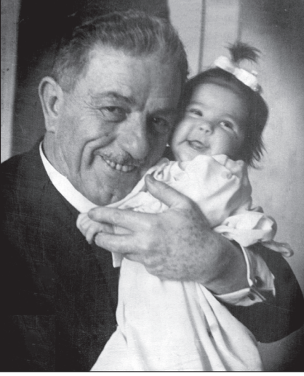
Ayşe Şasa büyük dayısı Rauf Orbay ile

olarak bir ihtilafa düşüyor ve iftiraya uğruyor. Hayatının dokuz yılını yurtdışında sürgünde geçiriyor. Rauf Dayımın gözden düştüğü dönemde, annemin ailesi büyük bir sıkıntıya düşer oluyor. Büyükbabam da bu durumda saf dışı kalıyor. Anneannem yapayalnız, bir sürü çocuk var ailede, büyük teyzemin çocukları, annem ve kız kardeşi... Büyük bir yalnızlık ve darlık dönemi geçiriyorlar. Aynı şekilde,