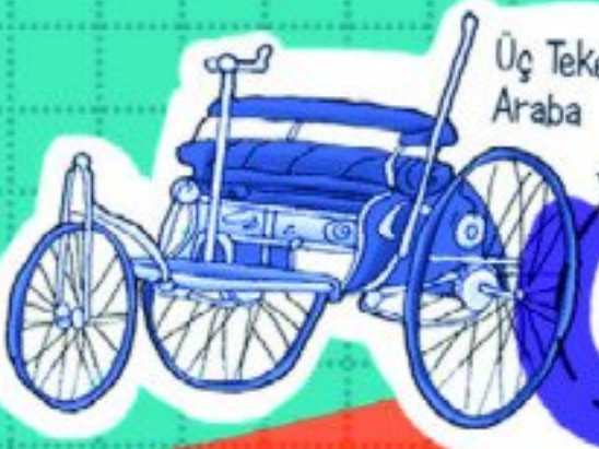
Üç Tekerlekli Araba