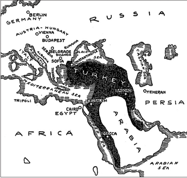
1913 yılında Osmanlı İmparatorluğu'nun özellikle Afrika ve Balkanlar'daki toprak kaybı göze çarpmaktadır.

İlerleyen yıllardaki savaşlar da Osmanlı İmparatorluğu'ndan toprak alıp götürmeye devam etmişti. Bulgaristan 1908'de bağımsızlığını ilan etmişti. 1912'de ise Yunanlar, Sırp, Bulgarlar ve Karadağlılar birleşerek Osmanlı İmparatorluğu'na saldırmışlardı. Balkan Savaşı daha önce Trablusgarp'ı kaybeden Osmanlı İmparatorluğu'nun, Midye-Enez hattının batısındaki topraklarla birlikte Girit'i de kaybetmesine neden olmuştu. İkinci Balkan Savaşı sırasında Osmanlı İmparatorluğu Edirne'yi ve kaybettiği bazı toprakları tekrar ele geçirmişti. Sonuç olarak Osmanlı İmparatorluğu 1914 yılında İttifak güçlerinin yanında savaşa girerek kendi varlığını sonlandırmıştı.