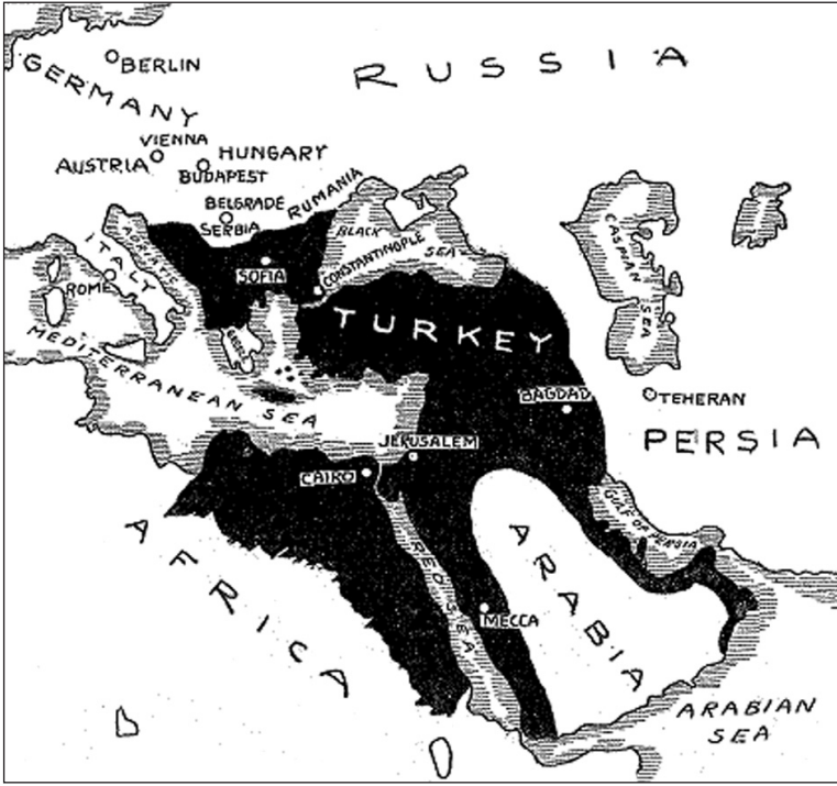
1833 yılında Osmanlı İmparatorluğu

neye çıkmıştı. Türklerle birçok savaş yapmışlar ve Osmanlı topraklarındaki Ortodoks Hristiyanları koruma hakkını elde ederek Türk sorununun modern safhasının başlamasında etkili olmuşlardı.