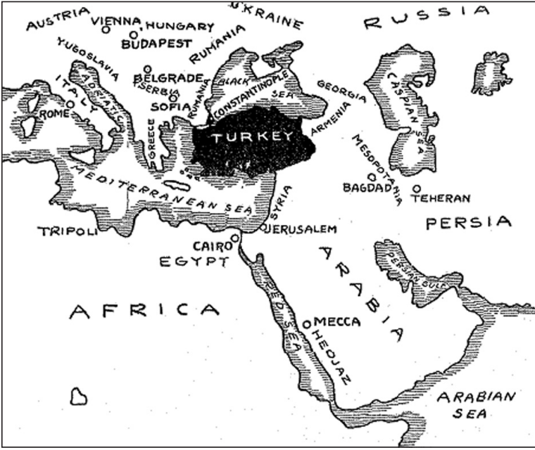
Paris Konferansı'nda alınan kararlara göre Türkiye sınırları

İstanbul'un Türklere mi yoksa uluslararası bir gücün kontrolüne mi verileceği problemi vardı. Fransızlar bu hususta Türkleri destekliyorlardı. Bu karışıklıkta Osmanlı İmparatorluğu parçalanıyordu ve bu durum Paris'teki konferansa çözüm olarak sunuluyordu.