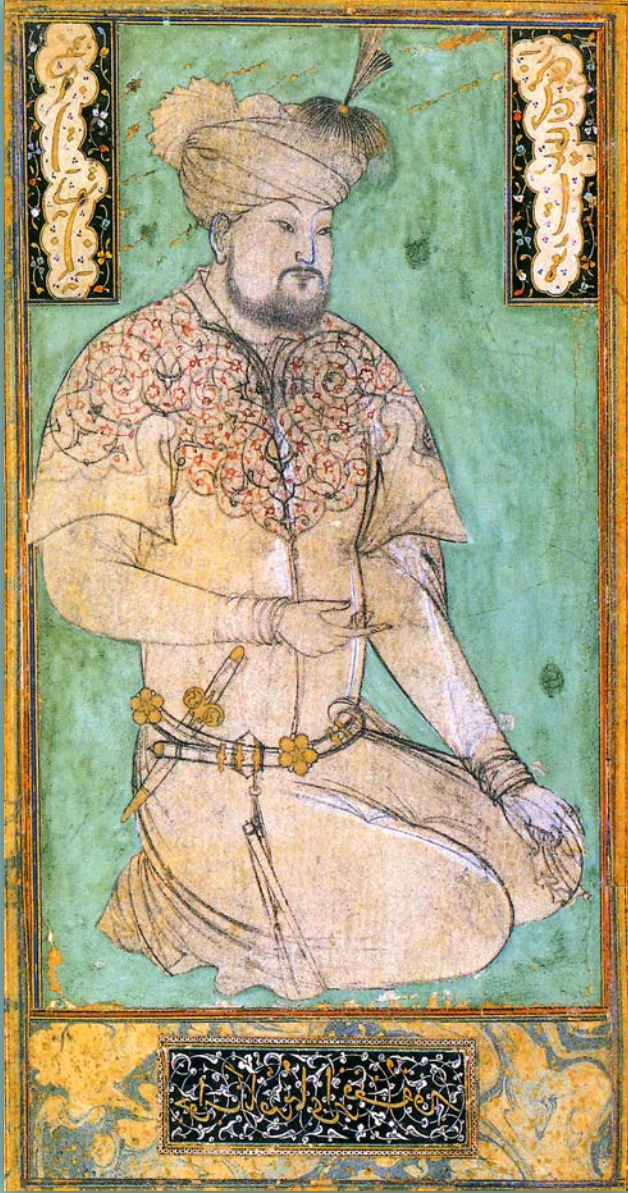
Resim altı yazısı (Kaynak)