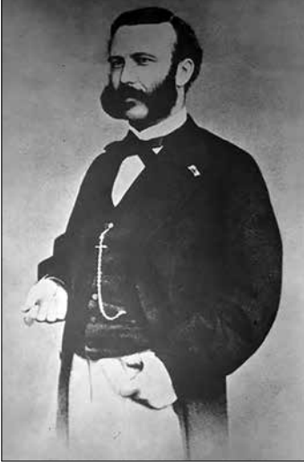
Resim 1: Henry Dunant (1828-1910) Bir Solferino Hatırası 'nı yazdıktan sonra (1860 öncesi)