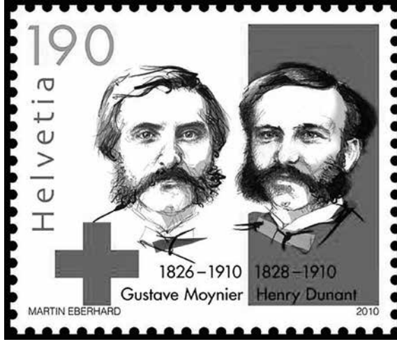
Resim 4: Moynier ve Dunant'ın ölümünün 100. yılı anısına İsviçre tarafından bastırılan pul

İlk on yıl içerisinde, Paris Kızılhaç Cemiyeti ile hareketin merkezi olma savaşıdan galip çıkmış, 1869 Berlin Kızılhaç Cemiyetleri Konferansı ile Cenevre Merkezi'nin uluslararası statüsü teyit edilmiş; Prusya-Danimarka (1864), Avusturya-Prusya (1866), Fransa-Prusya (1870), İspanya İç Savaşı (1872-1876), Balkan Krizi (1875-1878) gibi savaşlara Uluslararası Kızılhaç Komitesi tarafından müdahil olunmak suretiyle siyaseten güçlü bir konuma gelmişti. 1878'e gelindiğinde Uluslararası Kızılhaç Komitesi, istediği siyasi entiteye (Sırbistan ve Karadağ Emaretleri gibi) Cenevre Sözleşmesi'ni imzalatabilen, millî yardım cemiyetlerinin kesin kuruluşu kendi onayına bağlı olan ve tüm yardım cemiyetleri arasındaki koordinasyonu layıkıyla yerine getirebilen bir statüye ulaşmıştı. Fransa-Prusya Savaşı'nda yaralı ve ele geçirilen askerlerin ailelerine bilgi vermek amacıyla Uluslararası Kızılhaç Komitesi bir bilgi merkezi kurmuş, 1875-1878 yılları arasında yaşanan Sırp-Osmanlı ve Rus-Osmanlı savaşları boyunca, Trieste'de kurulan ajans vasıtasıyla savaş yakından takip edilmiş, 1885-1886 Sırp-Bulgar ve 1912-1913 Balkan Savaşları esnasında yine ajanslar kurmak suretiyle yardım faaliyetleri organize edilmiştir.