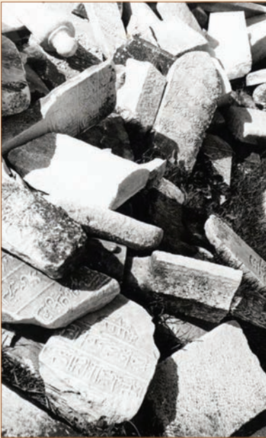
Mezar taşları kırılıp Balmumcu'da açılan kireç kuyularına taşınmış

Önce, mezarlıkta bulunan tüm mezar taşları toplatıldı. Sonrasında tarihimiz, manevi değerlerimizin adeta hiçe sayıldığı bir olaya şahit oldu.