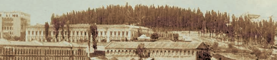
Kabataş yönünden mezarlığın görüntüsü

Mezarlığa vurulan ikinci darbe ise Abdülaziz Han dönemine aittir. Zamanla Avrupadaki gücünü arttıran Almanya, yeni