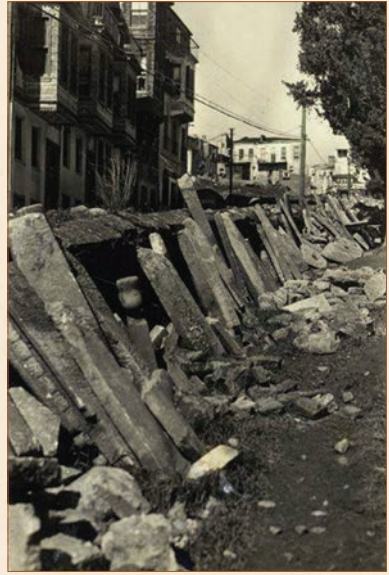
Mezarlığın kabir taşları sökülüp duvara dizilmiş