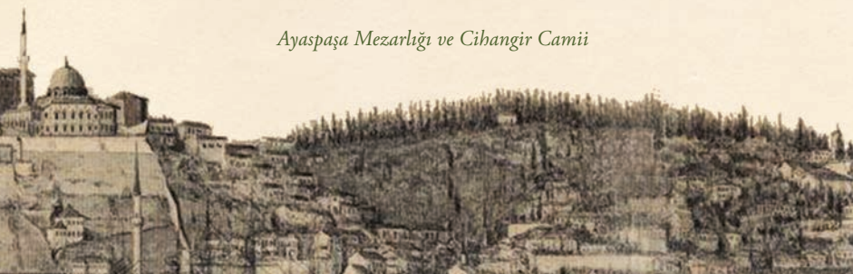
Ayaspaşa Mezarlığı ve Cihangir Camii

Beyoğlu bölgesinin gelişimi, takriben XIX. yüzyılın başlarına rastlar. Bu dönemde Taksim'deki su maksemelerinin devamı tamamıyla ıssız bir alanı oluşturduğundan, bu bölgede herhangi bir yapılanma bulunmaz. Yalnızca Taksim'den başlayıp Gümüşsuyu'ndan devam ederek Dolmabahçe'ye inen yamaçların bir kısmı ve diğer kolda günümüz Harbiye'sine kadar olan tüm arazi, mezarlıklarla kaplıdır. Burada sadece Müslüman