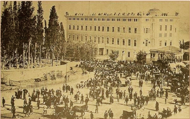
Mezarlık ve Alman Konsolosluğu

Türkiye’de basın ve gazeteciliğin öncüsü Şinasi, 13 Eylül 1871 tarihindeki vefatından sonra Ayaspaşa Mezarlığı’na defnedilir. Lâle Devri’nde, 1727 yılında vefat eden ünlü tarihçi Silahtar Mehmed Ağa gibi pek çok önemli şahsiyetin de ebedi istirahatgâhı olan mezarlığa, tarihimizin en acı yenilgilerinden biri olan 93 Harbi’nde (1877-1878 Osmanlı Rus Savaşı) yaralanıp Gümüşsuyu Askerî Hastanesi’ne getirilen ve burada şehit olan askerlerimiz de defnedilir.