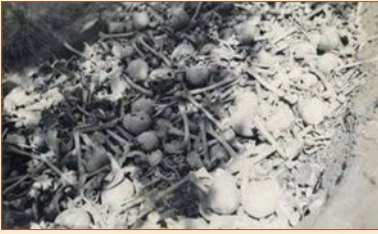
Ne hazin bir görüntü. Mezarlar açılmış, kemikler üstüste yığılmış