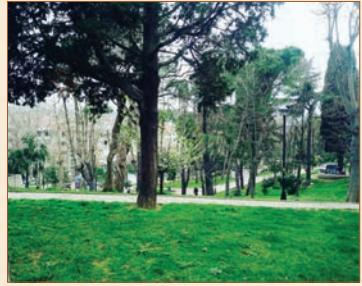
Abbasağa Mezarlığı'nın parka dönüştürülmüş hali

1950’lerde çekilen yandaki fotoğrafta, Balmumcu Garnizonu yakınlarında bulunan bir grup mezar taşı görülür. Taşlar her nasılsa katliamdan arta kalmayı başarmıştır.