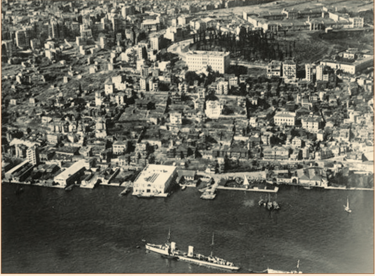
Ayaspaşa Mezarlığı'nın havadan görünümü

Kanuni Sultan Süleyman dönemi sadrazamlarından Ayas Paşa da Taksim civarına bir konak yaptırır ve bu civardaki büyük araziler de paşanın vakfına tahsis edilir.