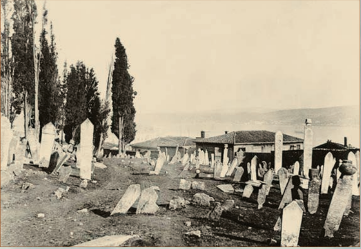
Ayaspaşa Mezarlığı'nın içi

mezarlıkları değil, Elmadağ kısmında Ermeni Gregoryen Mezarlığı, Gümüşsuyu'ndan Dolmabahçe yönündeki sağ tarafta ise Katolik Mezarlığı bulunur. Taksim'den Gümüşsuyu Askerî Hastanesi'nin olduğu ve günümüzde Alman Konsolosluğu'nun bulunduğu alandan Dolmabahçe'ye inen sırtlara kadar tüm arazi Müslüman mezarlığıdır. Alan, mekânın ilk sahibi olan Ayaspaşa Vakfı'ndan dolayı "Ayaspaşa Mezarlığı" ismini alır.