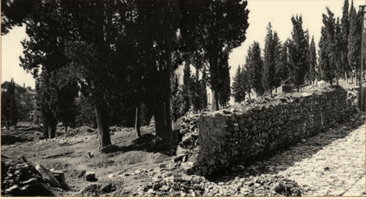
Abbasğa Mezarlığı'nın dış görünüşü

“Avcı Mehmed” olarak da bilinen Sultan IV. Mehmed döneminde, hayırseverliği ile sarayda nam salmış bir Darüssaade ağası vardır. Adı Abbas bin Abdürrezzak olan bu ağa, “Abbas Ağa” olarak tanınır. XVII. yüzyıl ortalarında Topkapı Sarayı’nın en ünlü ağalarından biri olan Abbas Ağa, Hatice Turhan Sultan’ın has dairesinde yetişir ve sultanın oğlu Avcı Mehmed’in üzerindeki etkisi nedeniyle 1668 yılında Kızlarağası olur. Darüssaade ağaları haremî yönetmenin yanı sıra Haremeyn vakıflarının nazırlığını da yaparlardı. Bu nazırlıkta, padişah ve üst düzey devlet ricâlinin Haremeyn’deki vakıflarının yönetimine bakılırdı. Osmanlı’da okuma-yazma ve öğrenme yaşına gelmiş şehzadeler için düzenlenen Bed-i Besmele töreninden sonra şehzadenin kalan eğitimine Darüssaade ağasının dairesinde devam edilirdi.* Sahip oldukları bu imtiyazlar sebebiyle önemli gelirlere de sahip olan Darüssaade ağaları hayır işlerine de önem verirler, çokça hayır yaparlardı.