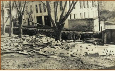
Mezarların kapak taşları bir köşeye yığılmış