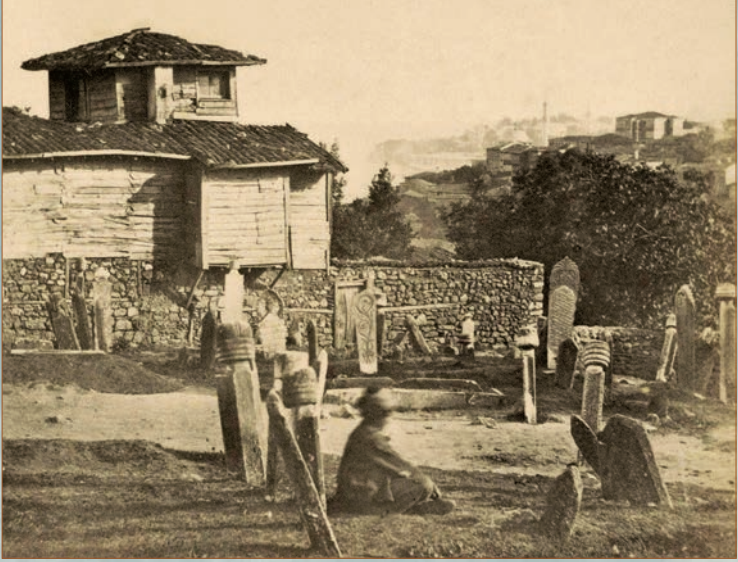
Ayaspaşa Mezarlığı'nın Doğu kısmı

XIX. yüzyılının ortalarına gelindiğinde Ayaspaşa Mezarlığı, gelişmekte olan Beyoğlu bölgesi için hem resmî kurumların hem de özel şahısların iştahını kabartmaya başlar. Mezarlığa ilk darbe, Sultan Abdülmecid'in talimatı ile Dolmabahçe Sarayı inşasında vurulur.