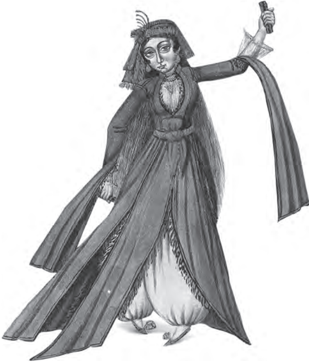
Temsili cariyeh çizimi ( Fenerci Mehmed Albümü , pl. 90)

Padişahın bu özel hizmetkârlarının dışında, haremın genel işleriyle ilgilenen ustalar da vardı. Bunlardan kutucu usta, maiyetindeki kalfalarla beraber sultan, kadınefendi ve ikballerin hamamda yıkanmalarına yardımcı olur ve hamam takımlarını muhafaza ederdi. Külhancı usta ise haremdeki