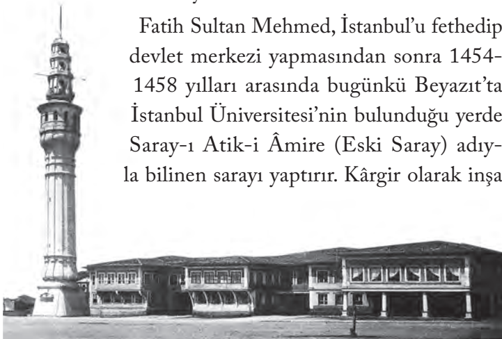
Eski Saray'ın bazı bölümleri (B. Öztuncay, Dersaadet'in Fotoğrafçıları , I, 87)

Fatih Sultan Mehmed, İstanbul'u fethedip devlet merkezi yapmasından sonra 1454-1458 yılları arasında bugünkü Beyazıt'ta İstanbul Üniversitesi'nin bulunduğu yerde Saray-ı Atik-i Âmire (Eski Saray) adıyla bilinen sarayı yaptırır. Kârgir olarak inşa