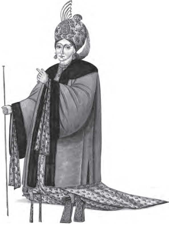
Haremin en yetkili kadını Kethüda veya Kâhya Kadın ( Fenerci Mehmed Albümü , pl. 23)

hazinedar usta, berber usta, çaşnigir usta, çamaşır usta, ibriktar usta, kahveci usta, kilerci usta, kutucu usta, külhancı usta ve kâtibe ustaydı. Gedikli cariyelerin her birinin ayrıca birinci, ikinci, üçüncü... diye sıralanan yardımcıları vardı. Kethüda kadın dışındaki gedikli cariyeler hem padişahın hem de valide sultanın hizmetinde ayrı ayrı kadrolar olarak da yer alırlardı.