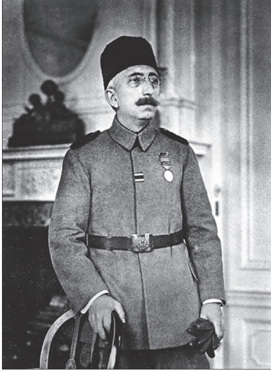
36. Osmanlı padişahı, son sultan VI. Mehmed Vahdeddin

kurtarılmış ise de henüz pek kıymetli kısımları onun istilası altında bulunuyor. Ordunun kahramanca başladığı vazifesini şerefle hitama erdireceğine emniyetim tamdır.