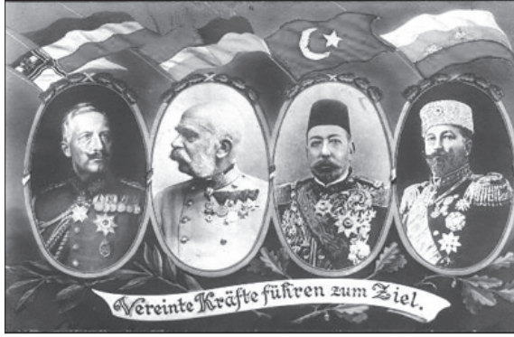
Almanya, Avusturya- Macaristan, Osmanlı İmparatorlukları ve Bulgaristan Krallığı ittifakını gösteren ve üzerinde "İttifak Kuvvetleri hedeflerine ulaştı" yazan bir kartpostal

İmparator Karl'ın 3 Kasım 1918'de İtalyanlarla Villa Gusti'de mütareke imzalaması imparatorluğun parçalanma sürecini daha da hızlandırdı. 29 Ekim'de Prag'da Çekoslovakya'nın, Zagreb'de de Sırp-Hırvat-Sloven (Yugoslavya) Devleti'nin kurulduğunun ilan edilmesi üzerine Avusturya Almanları da 30 Ekim'de Avusturya Cumhuriyeti'ni kurdular. Ardından Kasım ayında Macaristan Cumhuriyeti'nin kurulduğu ilan edilince İmparator Karl, tahtsız kaldı. İmparatorun 18 Kasım'da devlet işlerinden çekildiğini açıklamasıyla imparatorlukla birlikte Habsburg Hanedanı da tarihe karışmış oldu.