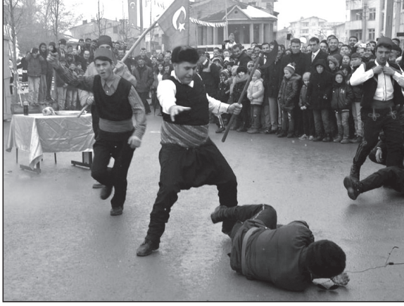
Geleneksel kurtuluş törenlerinden bir sahne