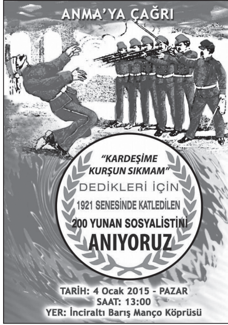
Olmayan bir olayın anma töreni afişi