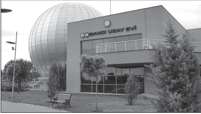
Eskişehir Bilim Parkı

da devâm etmiş: “Bize düşen görevse, Batı’dan bu konuda fazla geri kalmamayı temindir.” Gerçekten de inanılmaz... İnanılmaz; çünkü NASA bile ancak 1 Ekim 1958 târihinde kurulacaktır!