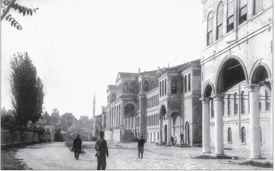
Bâbiâli'nin bahçe tarafından genel görünüşü ( Sultan II. Abdülhamid Arşivi , s. 481).

günleri sabah namazından sonra sadrazam konağında toplanıp halkın sorunlarını görüşen Cuma Divanı ( Huzur Mürâfaası ) da vardı.