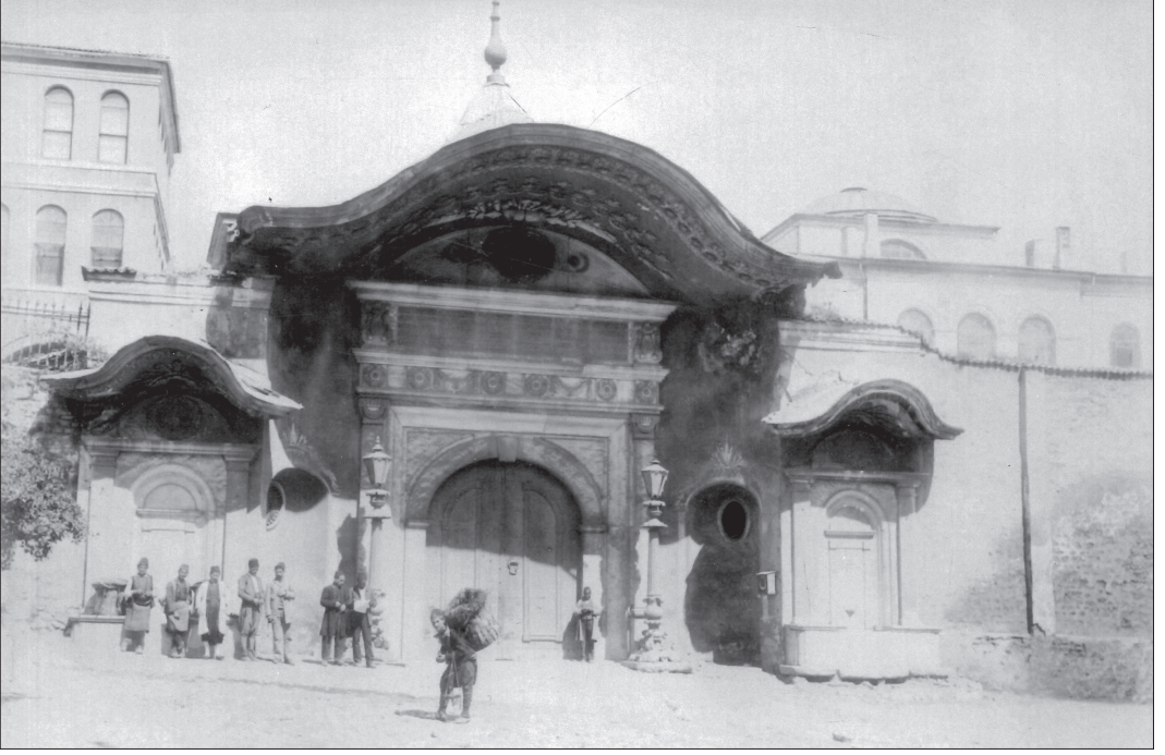
Bâbüâli'nin ana giriş kapısının Alay Köşkü tarafından görünüşü ( Sultan II. Abdülhamid Arşivi , s. 480).

patriklerinin kapıkâhyaları, devlet erkânı ve ulemanın kapıçukadarları ve yabancı sefirlerin Bâbüâli'deki işlerini takiple görevli tercümanlarıydı. 17