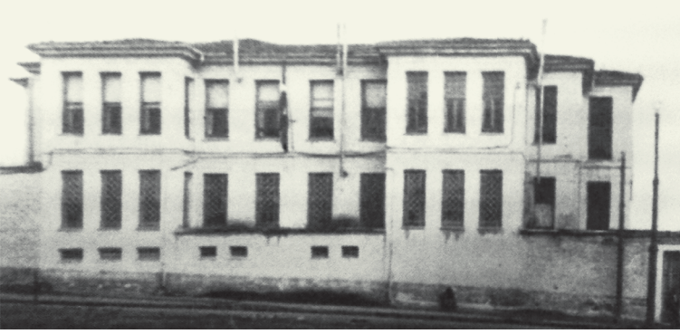
♦ Perestu'nun Maçka'daki sarayının fotoğrafı,

[L. Açba, Hatıralar, ekler kısmı; s. 89].