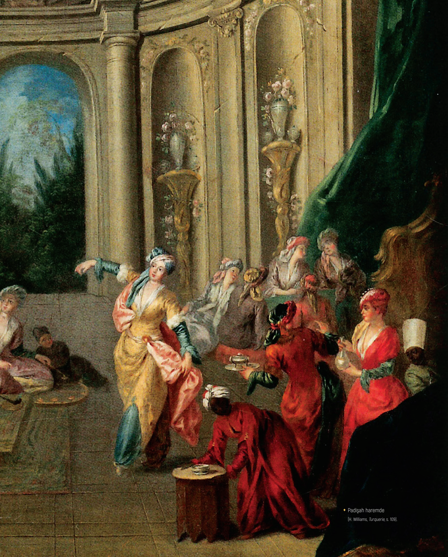
♦ Padişah haremde (H. Williams, Turquie , s. 109).