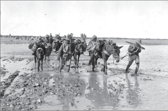
Şiddetli yağmurun ardından balçık haline gelen zeminde yürümeye çalışan İngiliz askerleri

Bunların yanında belirtmek gerekir ki konjonktürel olarak her iki tarafa da yaklaşabilen Arap aşiretleri daha çok Osmanlılara yakın durmuşlar, hatta Bağdat düştüğünde (1917 yılı ilkbaharı) bile Osmanlılara karşı kesin bir düşmanlık göstermemeye dikkat etmişlerdir. Ancak İngiliz kuvvetlerine olduğu gibi Osmanlı kuvvetlerine karşı da yağmacı saldırılarda bulunmaktan çekinmemişlerdir.