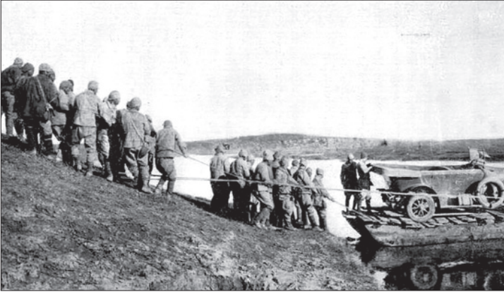
Nehir taşımacılığında ve ulaştırma faaliyetlerinde çok önemli yeri olan kelek, kuffa ve şahturlar