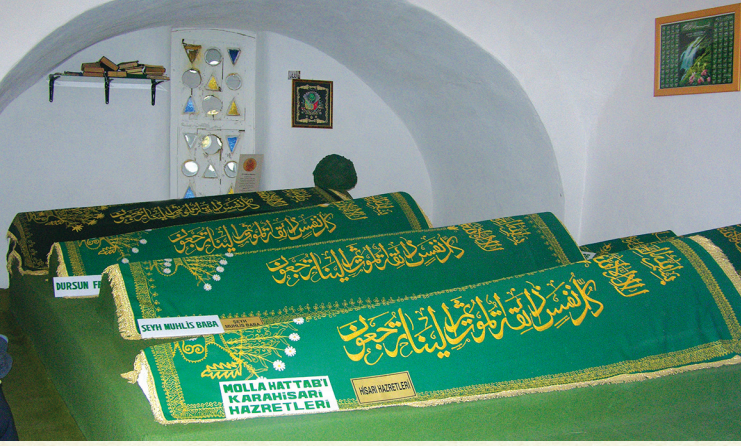
Şeyh Edebalı Türbesi

yaşayan Mevlana Celaleddin-i Rumî Hazretleri bulunuyor. Ahilerin başında ise Kırşehir'de ikamet eden Ahi Evran var. Biri Konya'da diğeri Kırşehir'de öyle bir teşkilatlanmışlardır ki Anadolu'nun en ücra köylerine kadar bu hareketler yayılmıştır. Aslında o günün Müslümanlarında bir yılgınlık var, neden mi? Orta Asya'dan kopup gelen inançsız ve vahşi Moğollar, "Müslümanları nasıl yenebilirler?" diye hem kendi ırklarını hem de dinlerini sorgulamaya başlamışlar. Dolayısıyla değerlerinden bir soğuma söz konusu, bir kaçış var. Böyle sıkıntılı bir dönemde Mevlana ve Ahi Evran gibi iki adam çıkıp, "hayır siz özelsiniz, siz inancınızla güçlüsünüz, böyle bir sıkıntı olabilir ama bundan dersler çıkarmak lazım, bu bizim bazı hatalarımızın neticesidir, silkinip kendimize gelmeliyiz," diyorlar ve Anadolu'yu yeniden toparlıyorlar.