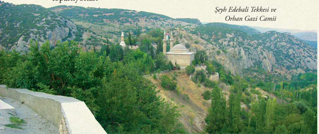
Şeyh Edebalı Tekkesi ve Orhan Gazi Camii

yaşayan Mevlana Celaleddin-i Rumî Hazretleri bulunuyor. Ahilerin başında ise Kırşehir'de ikamet eden Ahi Evran var. Biri Konya'da diğeri Kırşehir'de öyle bir teşkilatlanmışlardır ki Anadolu'nun en ücra köylerine kadar bu hareketler yayılmıştır. Aslında o günün Müslümanlarında bir yılgınlık var, neden mi? Orta Asya'dan kopup gelen inançsız ve vahşi Moğollar, "Müslümanları nasıl yenebilirler?" diye hem kendi ırklarını hem de dinlerini sorgulamaya başlamışlar. Dolayısıyla değerlerinden bir soğuma söz konusu, bir kaçış var. Böyle sıkıntılı bir dönemde Mevlana ve Ahi Evran gibi iki adam çıkıp, "hayır siz özelsiniz, siz inancınızla güçlüsünüz, böyle bir sıkıntı olabilir ama bundan dersler çıkarmak lazım, bu bizim bazı hatalarımızın neticesidir, silkinip kendimize gelmeliyiz," diyorlar ve Anadolu'yu yeniden toparlıyorlar.