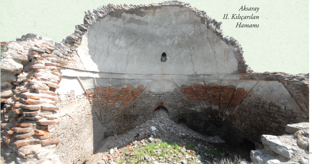
Aksaray II. Kılıçarslan Hamamı