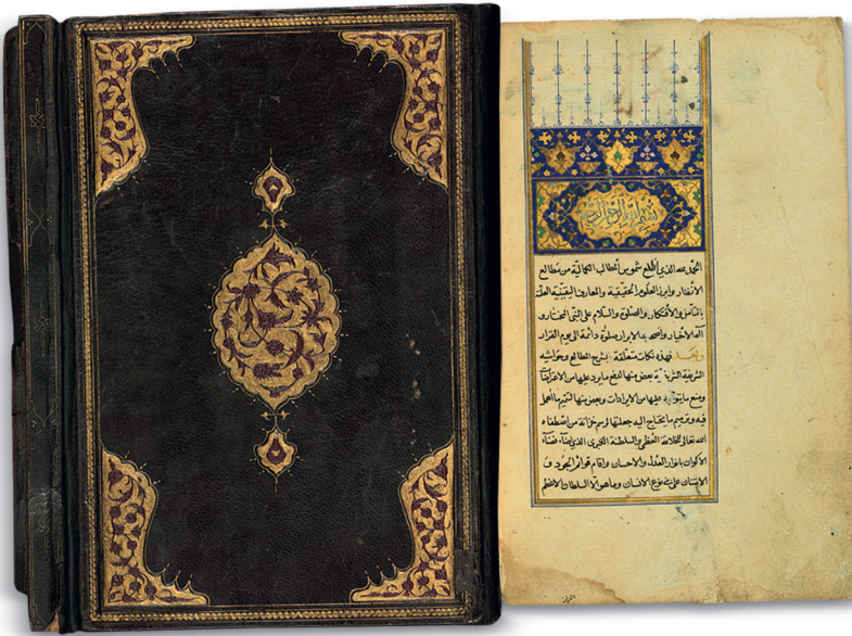
Tevârih-i Âl-i Osman'dan bir sayfa

Dünder Bey'in Osman Gazi tarafından öldürüldüğü iddia edilen tarihte Dünder Bey eğer hayatta ise 100 yaşına girmek üzere idi. Ayrıca iddialarda Osman Gazi'nin Bursa'yı fethine muhalefet ettiği, Bilecik ve Yarhisar tekfurlarının Osman Gazi'yi öldürme planlarına vâkıf olmasına rağmen bunu bildirmedigi