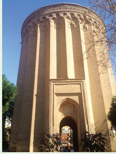
Tuğrul Bey'in İran'ın Rey şehrindeki kümbeti

Orta Asya geleneğinde devlet hanedan ailesinin ortak malı olarak kabul edilir. Bu anlayış bu dönemde de devam ediyor. Osmanlı'yı güçlü kılan şey Orta Asya'dan gelen bu çok ağır ve kesin kuralı nizam-ı âlem için kolaylıkla çiğneyebilmeleri olmuştur ki bu müthiş bir şeydir. Bu tabuları çiğneyebilmek oldukça zordur, Osmanoğulları bunu başarmış ve bu yüzden çok büyük bir imparatorluk haline gelmiş. Tabii ki "kanun kural var" diye ayaklananlar olmuştur. Anadolu Selçuklu'dan örnek verelim. II. Kılıçarslan on bir oğlu arasında devleti paylaşıyor, parça parça oluyor devlet. Daha kendisi hayattayken on bir oğlu birbirine giriyor. Dağılma sürecine giriyor devlet, II. Kılıçarslan bunun üzerine kalkıp Isparta'daki oğlu