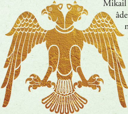
Selçukluların bayrağında da bulunan çift başlı kartal

Mikail öldüğünde dul kalan eşi, eski Türk âdetlerine göre küçük kardeş tarafından nikâhlanırdı. Küçük kardeş Yusuf ile evlenen bu hanımın O'ndan doğan oğlu İbrahim Yinal'dır.)