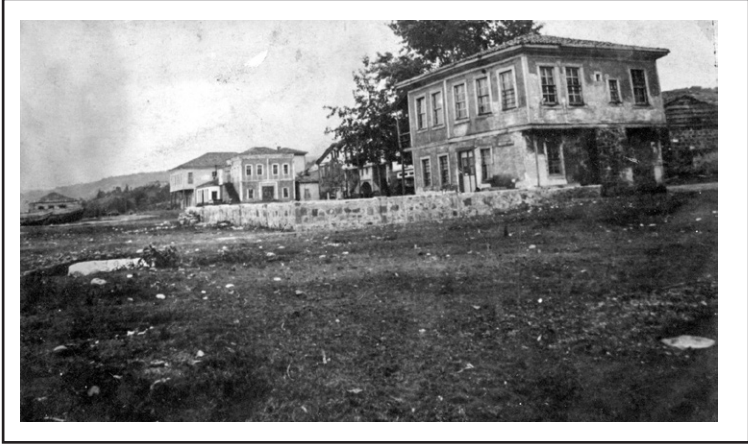
Vakfıkebir belediye binası, 1920'ler

başkanlıktan ayrılınca bu kez göreve babamı getirdiler. Babam da yasal yollara başvurup hidroelektrik santraline su sağlayan kanalları müteahhide yeniden yaptırdı. Böylece Vakfıkebir'e elektriği getiren başkan oldu.