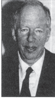
Rothschild: Euro venture

Its strategy will be to build up a number of long-term corporate relationships, earning its money through retainers, with additional fees for specific projects.