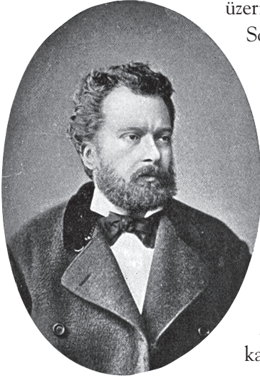
Ali Suavi'yi esaslı teşhis eden dostu Namık Kemal

üzerine azledildikten sonra kaleme döndü. Sofya ve Filibe'de çalıştı ise de burada da duramadı. Hac dönüşü muhtelif şehirlerde verdiği ateşli vaazlarla dikkat çekti. Hitabeti çok kuvvetliydi; dinleyenleri kolayca tesiri altına alırdı. Bir yandan da gazetelerde yazılar yazar; yazı dilini değiştirmek iddiasında bulunurdu. Jön Türklere katıldı. Hem hükümet hem millet gizli Jön Türk Cemiyeti'nden bu yazılar sayesinde haberdar oldu. Âli Paşa aleyhtarı yazıları, gazetenin kapanmasına ve de Kastamonu'ya sürülmesine sebep oldu.