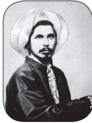
Ali Suavi'nin sarıklı bir fotoğrafı

Ali Suavi, Tanzimat Fermanı'nın ilan edildiği 1839 senesinde, Çankırı asıllı bir kâğıt esnafının oğlu olarak İstanbul'da dünyaya geldi. Orta mektebi bitirdi; biraz da cami derslerine devam edip kaleme kâtip (yazı işleri memuru) oldu. Bursa ve Simav'da orta mektep muallimliği yaptı. Şikâyet