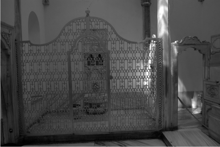
Topkapı Sarayı’ndaki hünkâr ve valide sultan hamamı

Yatak odasından mermer söveli ve demir şebekeli bir zar ile geçilen dua odası da benzer görünümündedir. Duvarında çiniden bir