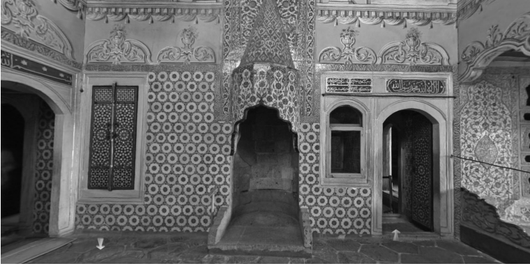
Valide sultan odası

Sofanın duvarlarının alt kısımları çinili, üst bölümleri ise 19. yüzyıl hayalî, panoramik manzara resimleriyle süslenmiştir. Sedef kakmalı gömme dolapları ve kapı kanatları eskidir. Bir ocak ve çeşmeye de sahip olan odaya kadife sedirler ve sofra takımı da kurulmuştur. Valide sultanlar yemeklerini burada yerlerdi.