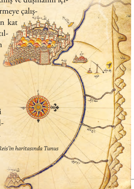
Piri Reis'in haritasında Tunus

düşmanın içine dalmakta, düşmana ciddi şekilde zayıf verdirip tekrar içeriye girmektedir. Barbaros Osmanlı askerleriyle, canlarını dışlarına takmış bu çetin mücadeleyi verirken şehirdeki Müslüman Tunusluların bir kısmı endişe içindedir. Ya Osmanlı kaybeder ve şehre Hristiyanlar girer de bize zarar verirlerse? İnanmış tüm sinnerin tek yürek olma zamanında, Hayreddin Paşa'nın yanında ölüme yer almaları gerekirken sırf can korkusu ve gelecek endişesiyle Hristiyanlara şirin gözükme adına şehir hapishanesindeki 10000'e yakın Hristiyan esiri serbest bırakılır. O anlarda Hayreddin Paşa ve birlikleri yine şehir surlarından dışarıya çıkmış ve düşmanın içine dalarak verebildikleri kadar zayıf verdirmeye çalışmaktadırlar. Sayıca Osmanlı birliklerinden kat kat üstün olan düşmanın yeterince yıpratıldığını düşünüp yeniden şehre girmek için sur kapılarına geldiklerinde onları acı bir tablo beklemektedir. İçerideki bu haince girişim neticesinde Şariken'e yaranmak isteyen Tunuslular ve serbest bıraktıkları esirler kapıları kapatmıştır. Osmanlı yığıtleri, sur duvarlarıyla düşman birlikleri arasında kalmıştır. Yapılacak tek bir şey kalmıştır, daha kuvvetli bir huruçla düşman