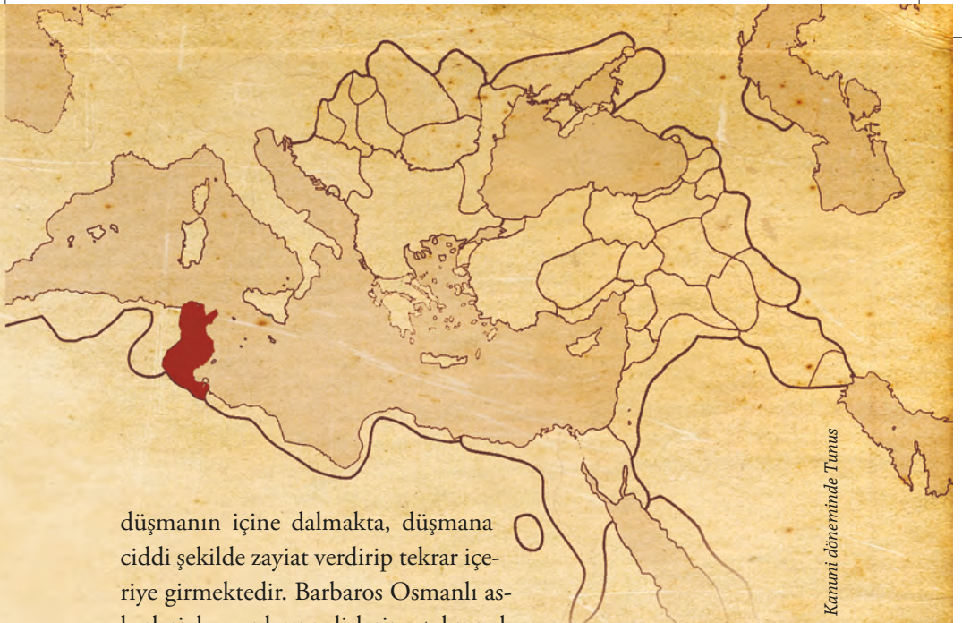
Kanuni döneminde Tunus

düşmanın içine dalmakta, düşmana ciddi şekilde zayıf verdirip tekrar içeriye girmektedir. Barbaros Osmanlı askerleriyle, canlarını dışlarına takmış bu çetin mücadeleyi verirken şehirdeki Müslüman Tunusluların bir kısmı endişe içindedir. Ya Osmanlı kaybeder ve şehre Hristiyanlar girer de bize zarar verirlerse? İnanmış tüm sinnerin tek yürek olma zamanında, Hayreddin Paşa'nın yanında ölüme yer almaları gerekirken sırf can korkusu ve gelecek endişesiyle Hristiyanlara şirin gözükme adına şehir hapishanesindeki 10000'e yakın Hristiyan esiri serbest bırakılır. O anlarda Hayreddin Paşa ve birlikleri yine şehir surlarından dışarıya çıkmış ve düşmanın içine dalarak verebildikleri kadar zayıf verdirmeye çalışmaktadırlar. Sayıca Osmanlı birliklerinden kat kat üstün olan düşmanın yeterince yıpratıldığını düşünüp yeniden şehre girmek için sur kapılarına geldiklerinde onları acı bir tablo beklemektedir. İçerideki bu haince girişim neticesinde Şariken'e yaranmak isteyen Tunuslular ve serbest bıraktıkları esirler kapıları kapatmıştır. Osmanlı yığıtleri, sur duvarlarıyla düşman birlikleri arasında kalmıştır. Yapılacak tek bir şey kalmıştır, daha kuvvetli bir huruçla düşman