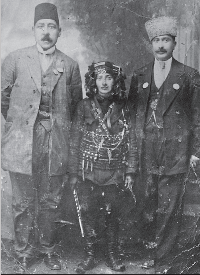
Kara Fatma (ortada), Bayezid Mebusu Süleyman Sadi Bey (sağda) ve Van Mebusu Hasan Bey (solda)