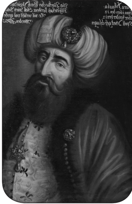
Merzifonlu Kara Mustafa Paşa

Düşmana karşı her türlü silahla karşı koyulur. Mısır’ın fethinde Osmanlıların seyyar toplarına karşılık; Mısırlıların çakılı topları vardı. Bu sebeple Osmanlı taarruzuna karşı hiçbir varlık gösterememişti. Harpten sonra Tomanbay, Yavuz Sultan Selim’e “Cennet,