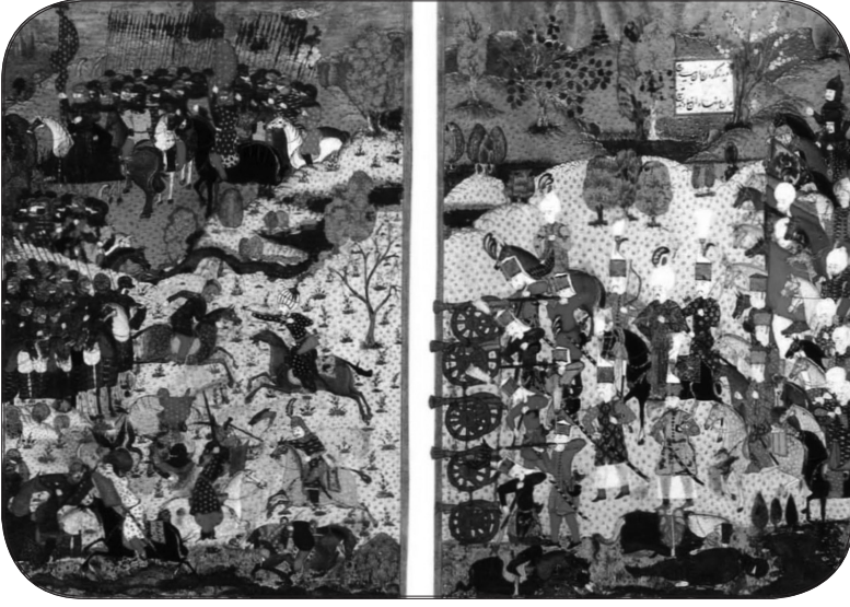
Mohaç Meydan Muharebesi'ni gösteren bir minyatür

ların bu çağrıyla işitmelerine; işitenlerin de iman etmelerine engel olan diktatörlerin orduları ile savaşılır. Dolayısıyla harbin sebebi Müslüman olmayanların düşmanlığıdır. Cihâd, sulhü temin etmek için yapılır. Osmanlılar için sömürgecilik meçhul bir mefhum idi. Fethedilen ülkelerin bir kısmı vatan edinilir; bir kısmında da mahallî idareciler başta bırakılarak tâbi devlet statüsü tanınırdı.