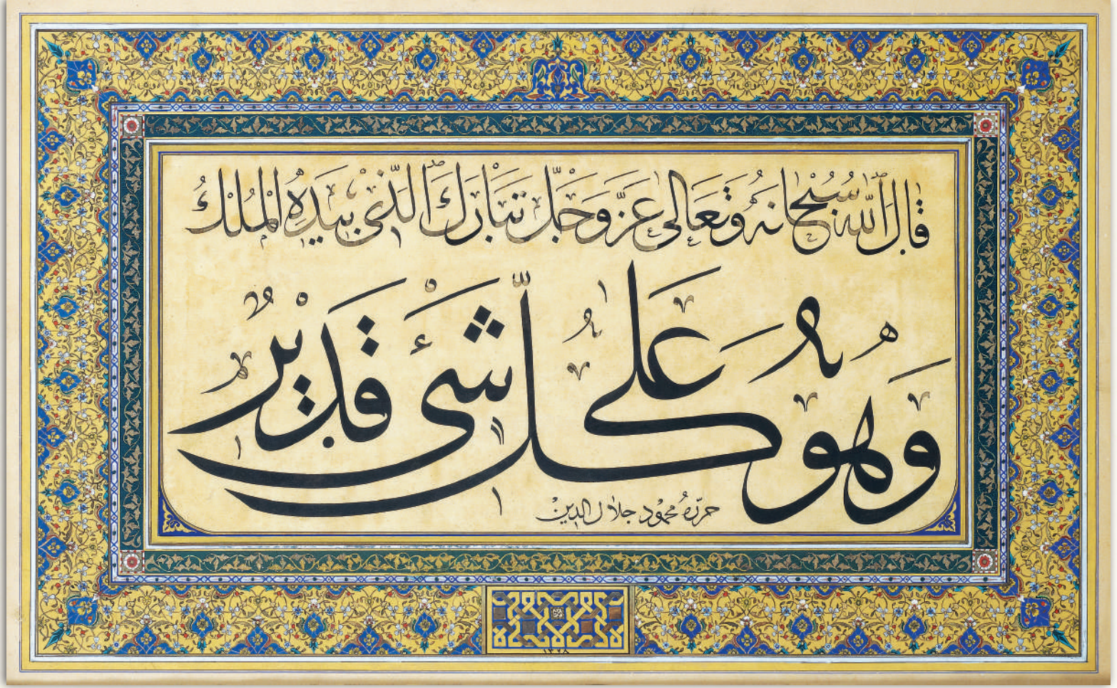
Kâle Allahu subhânehu ve teâlâ azze ve celle: "Tebârekellezî bi-yedihi'l-mülk ve hüve alâ külli şey'in kadîr- Hükümranlık elinde olan Allah, yücedir. O her şeye hakkıyla gücü yetendir." (Mülk sûresi, 67/1) Harrerehu Mahmud Celâleddin.