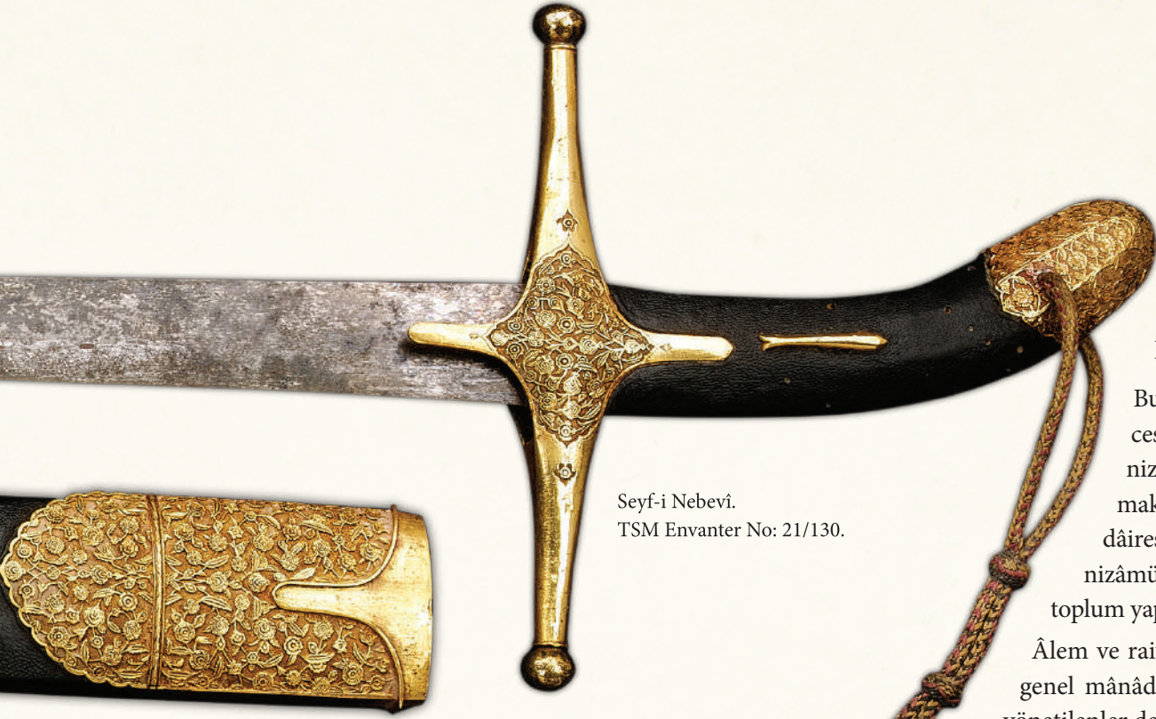
Seyf-i Nebevî. TSM Envanter No: 21/130.