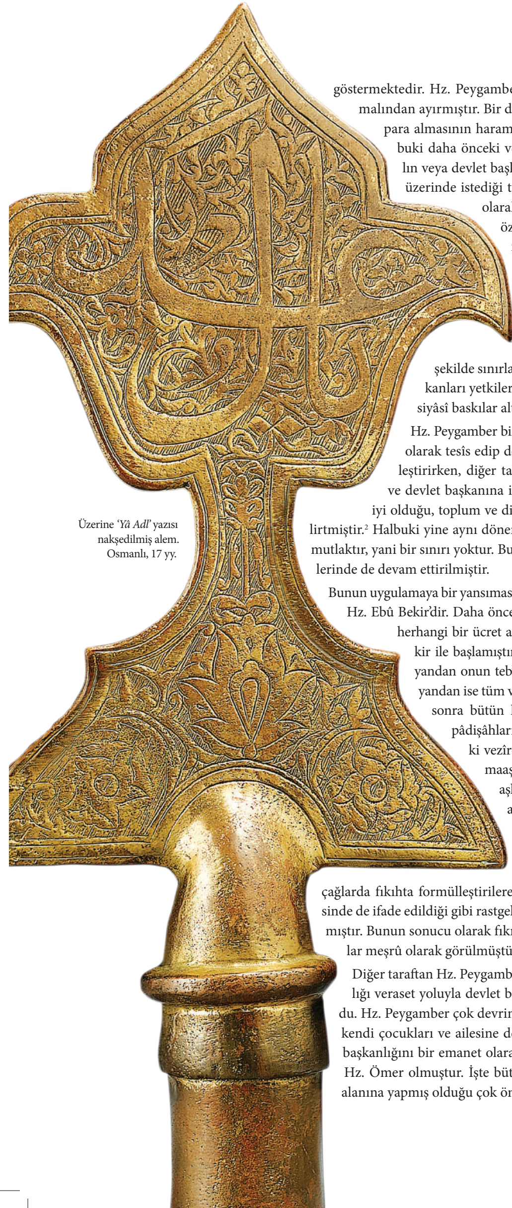
Üzerine 'Yâ Adl' yazısı nakşedilmiş alem. Osmanlı, 17 yy.

göstermektedir. Hz. Peygamber 'beytü'l-mâl' olarak bilinen devlet hazinesini kendi malından ayırmıştır. Bir devlet başkanı olarak kendisinin ve ailesinin o hazineden para almasının haram olduğunu çok açık bir şekilde ortaya koymuştur. Halbuki daha önceki ve o dönemki muâsır devletlerde devletin hazinesi kralın veya devlet başkanının malı olarak görülmüştür; devlet başkanı hazîne üzerinde istediği tasarrufu yapabiliirdi. Hz. Peygamber bir devlet başkanı olarak kendi şahsı ve ailesi için devlet hazînesindeki malları özel ihtiyaç ve amaçları için kullanma tasarrufu yetkisi olmadığı çok açık bir şekilde ifade etmiştir.