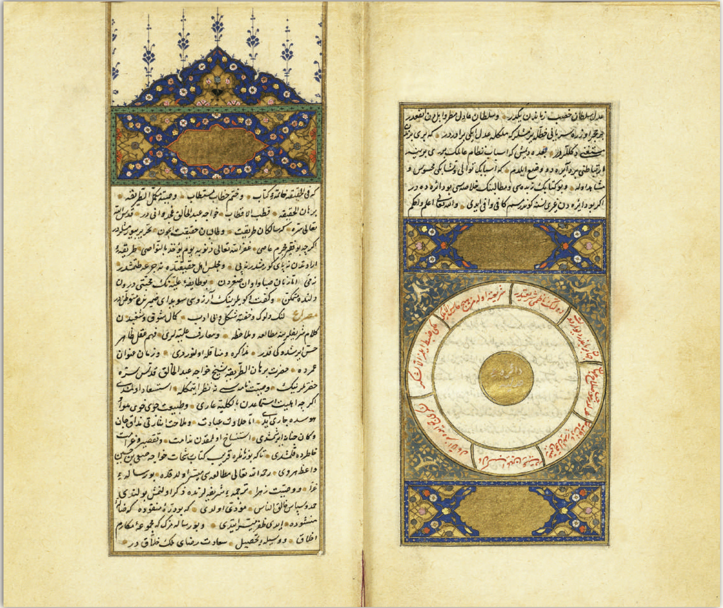
Ahlâk-ı Âlâî, Alaeddîn Ali b. Emrullah Kınalızâde. TY 4112. İstanbul Üniversitesi Kütüphanesi.

Hz. Peygamber devlete manevî şahsiyetini (tüzel kişilik) kazandırmış ve devleti müstakil bir kurum olarak kendi şahsiyetinden ayırmıştır. Devletin hazinesi ile kendi şahsi malını birbirinden ayırması bunun somut bir yansıması olarak kendisini