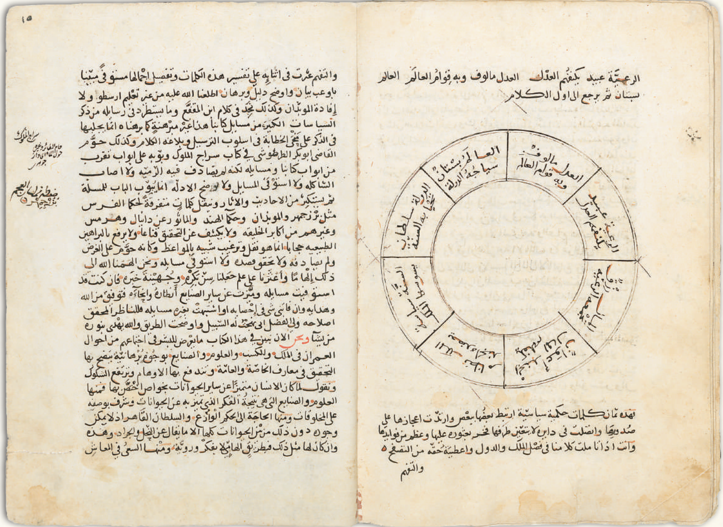
Mukaddime, İbn Haldun. Âtîf Efendi No: 1936. Süleymâniye Kütüphanesi.

Nitekim Hz. Ömer (r.a.) döneminde de Müslümanlar İnan devlet geleneğinden devlet bütçesinin yönetimi konusunda