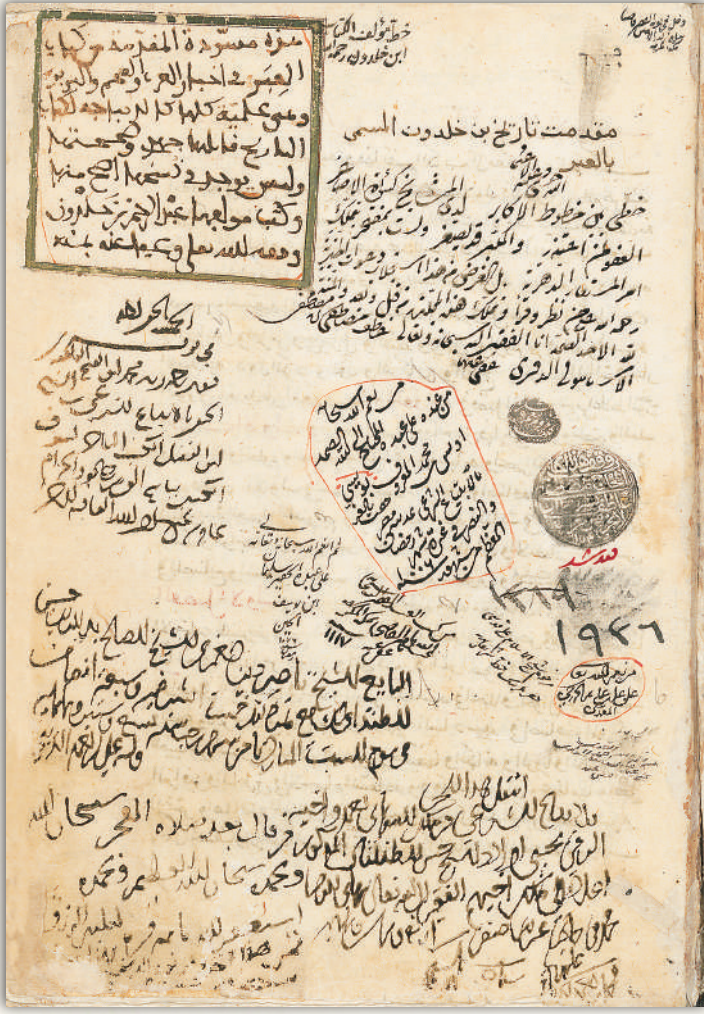
Süleymâniye Kütüphanesi, Âtîf Efendi, 1936 numarada kayıtlı bulunan Mukaddime nüshasının mühürlü sahifesi.

Taht. T.C. Kültür ve Turizm Bakanlığı Ankara Etnografya Müzesi.