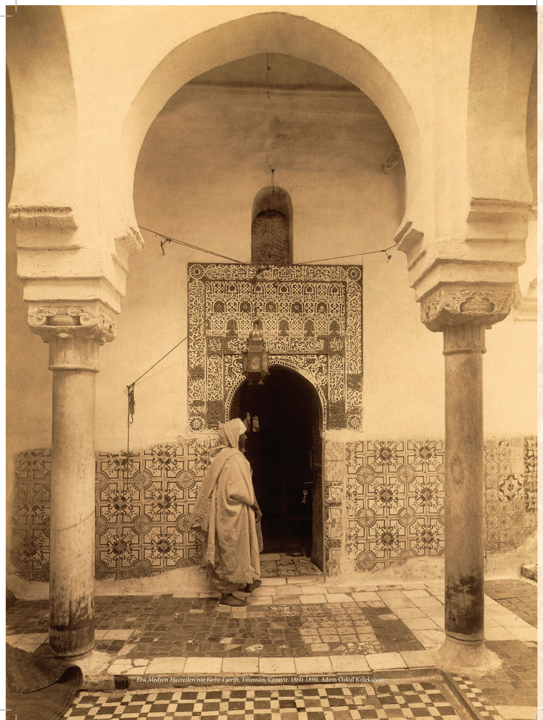
Ebü Medyen Hazretleri'nin türbe-i şerifi, Tilimsân, Cezayir. 1860-1890.